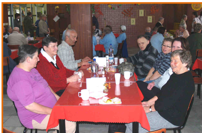
Soutěžící družstvo za DPS Stachy - Kúsov